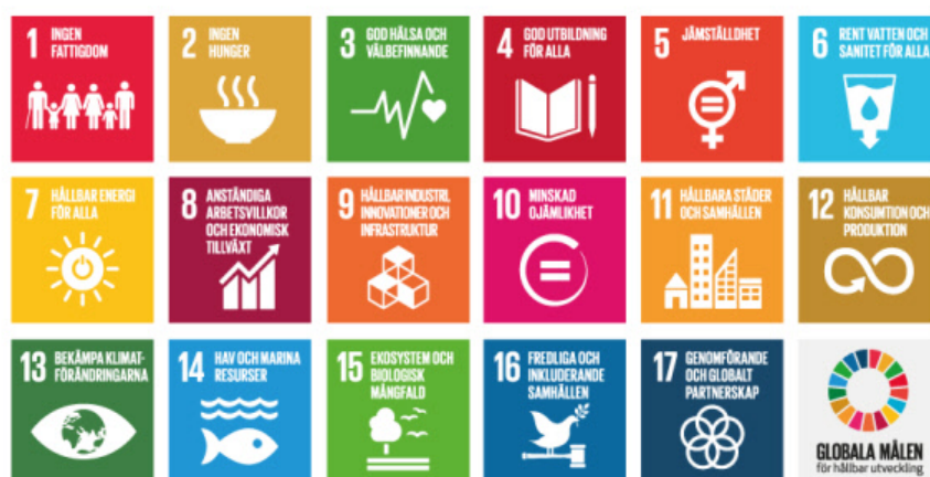
Bild 1. Målen för handlingsprogrammet för hållbar utveckling (Agenda 2030) Sustainable Development Goals, SDG)

Agenda 2030 består av gemensamma principer, 17 mål och 169 delmål som preciserar målen, medel för genomförande samt ett gemensamt system för uppföljning och utvärdering av genomförandet. Målen för Agenda 2030 är globala och gäller på lika villkor i alla länder i världen. För att genomförandet ska lyckas krävs det deltagande och insatser av alla aktörer i samhället, men regeringen har huvudansvaret för att handlingsprogrammet genomförs och målen uppnås.