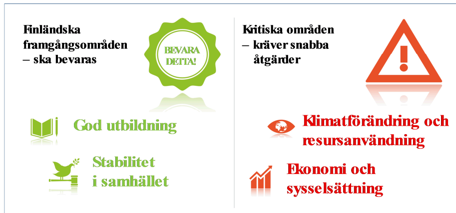
Bild 2. Centrala slutsatser i projektet Avain2030

I projektet Avain2030 identifierades den höga utbildningskvaliteten och anknytande kompetens samt den allmänna stabiliteten hos systemen i samhället som Finlands viktigaste styrkeområden inom hållbar utveckling. Som de största utmaningarna framstod bekämpningen av klimatförändringen och överkonsumtionen av naturresurser samt utvecklingen inom ekonomi och sysselsättning.