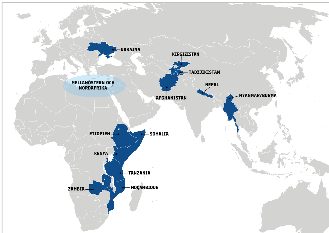
Partnerländerna i Finlands bilaterala utvecklingsamarbete år 2021.

utvecklingsamarbete är deras stora geografiska och tematiska omfattning, den stora volymen tillgänglig finansiering, den goda handlingsförmågan och genomslaget.